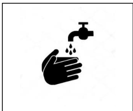
Hände gründlich waschen