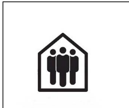
Zu Hause bleiben