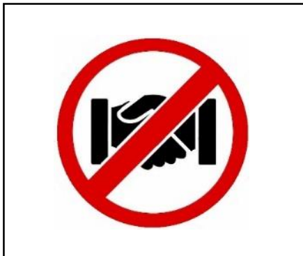
Kein Händeschütteln, körperliche Kontakte meiden