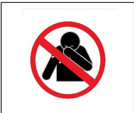
Husten und Niesen in die Armbeuge